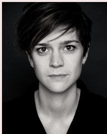
SKUESPILLER THEA KASTBERG