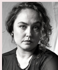
SKUESPILLER LINNEA FABRICIUS