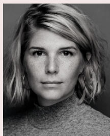
SKUESPILLER ANNE BLOMSGÅRD